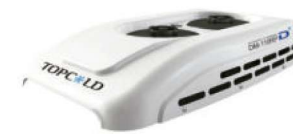
Condensador montado en el techo