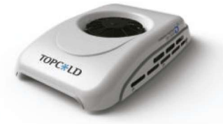
Condensador montado en el techo