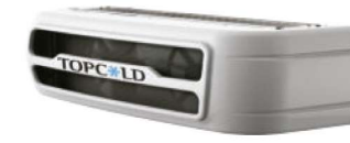
Condensador montado en la nariz