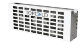
Debajo del condensador montado