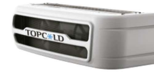
Condensador montado en la nariz