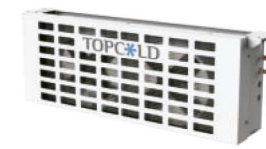
Debajo del condensador montado